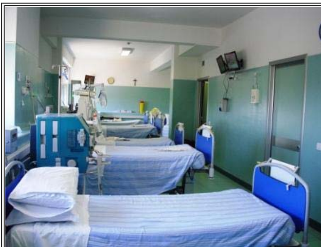
uno scorcio della sala emodialisi