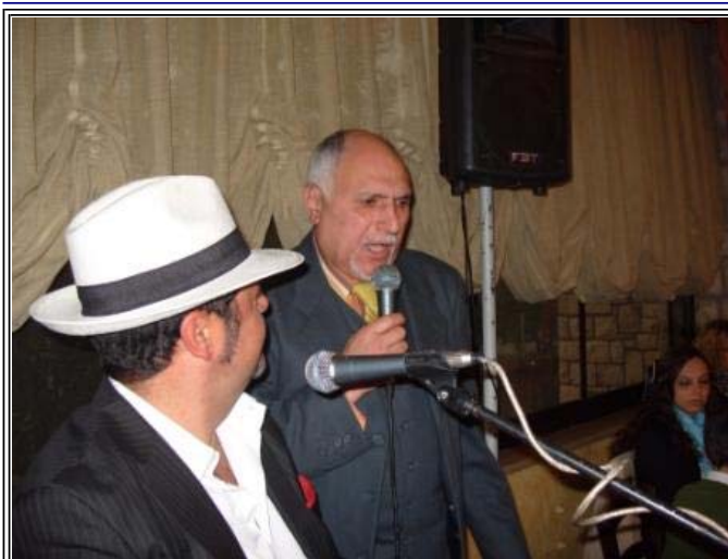
Un momento della festa

Anche quest'anno al centro dialisi di Monte San Biagio, UDD dell'ospedale di Formia, si è voluto festeggiare il Natale. Il 18 dicembre, la giornata è iniziata con la Santa Messa, celebrata presso il Centro Dialisi da don Emanuele, giovane parroco di Monte San Biagio. Le offerte raccolte sono state destinate alla Parrocchia che le utilizzerà per opere caritatevoli. Poi, tutti a pranzo, presso il Ristorante "Da Gianni Il Salernitano" a Monte San Biagio. Menù misto di carne, pesce ecc.ecc., musica, karaoke a volontà. Grande partecipazione di pazienti, familiari, infermieri,