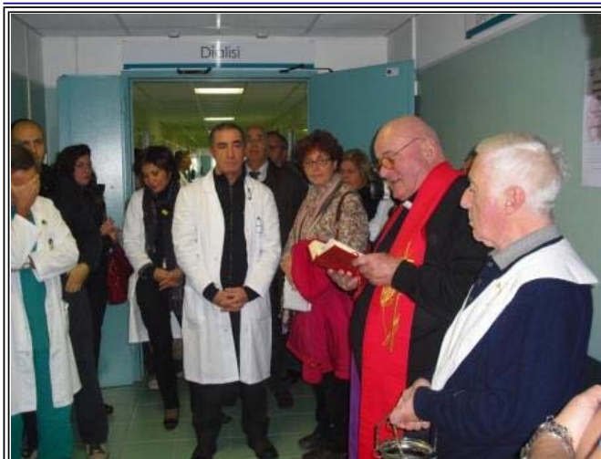
Un momento della cerimonia di inaugurazione

Dopo oltre 30 anni di attività, il vecchio centro dialisi dell'ospedale di Anzio ha chiuso i battenti. La struttura, oramai, mostrava tutti i segni del tempo. Al suo posto il nuovo centro dialisi realizzato al padiglione Faina, completato dopo decenni dall'inizio dei lavori. I nuovi locali della UOC di Nefrologia e dialisi sono ubicati nello stesso piano; nel primo corridoio vi è la sala emodialisi con 16 posti, una sala contumacia, una per HBsAg positivi e una per le urgenze, gli spogliatoi con i bagni e altri locali di servizio.